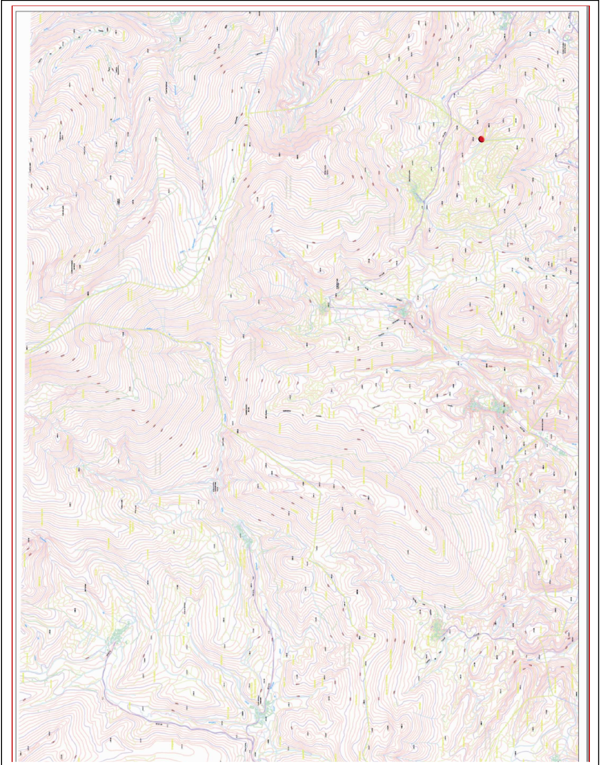
San Cebrían de Mudá. Escala 1/10000