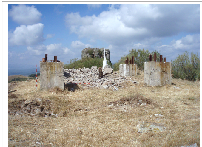
Restos del altar situado en el Alto de los Castillos.