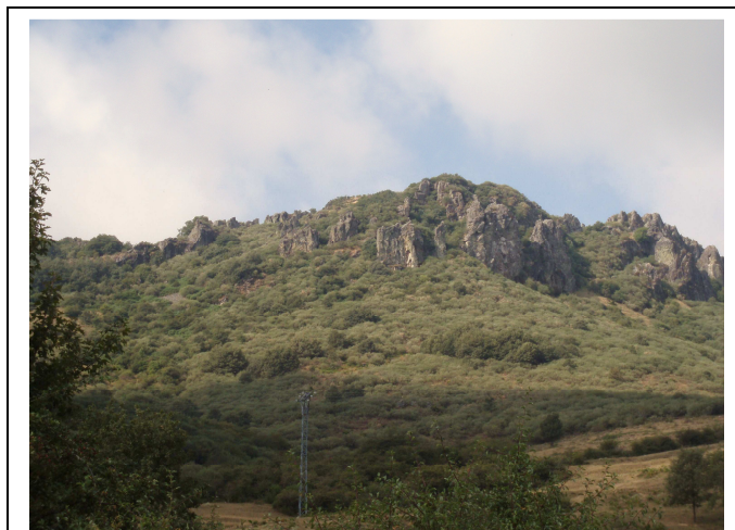
San Julián/Alto de los Castillos. Vista desde el Sur