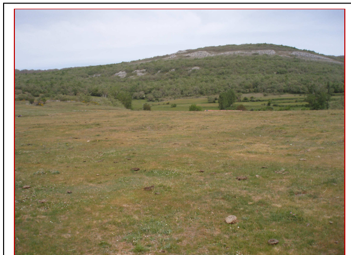
Las Eras desde Suroeste