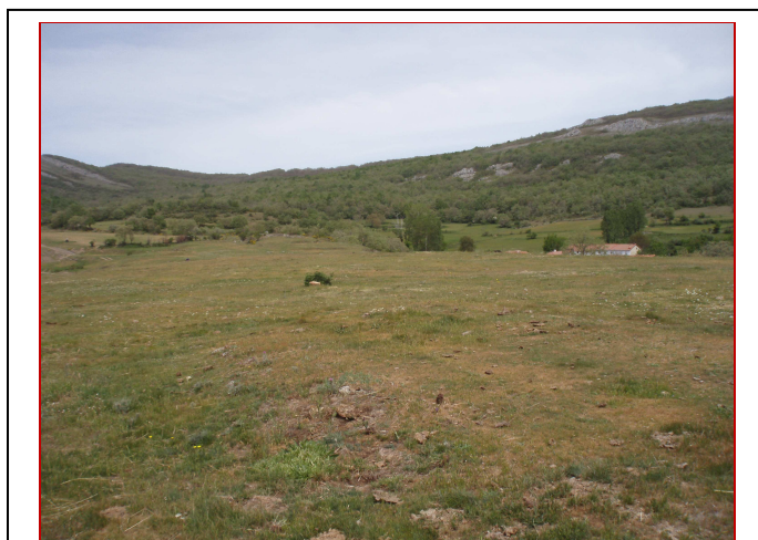
Las Eras desde Sur