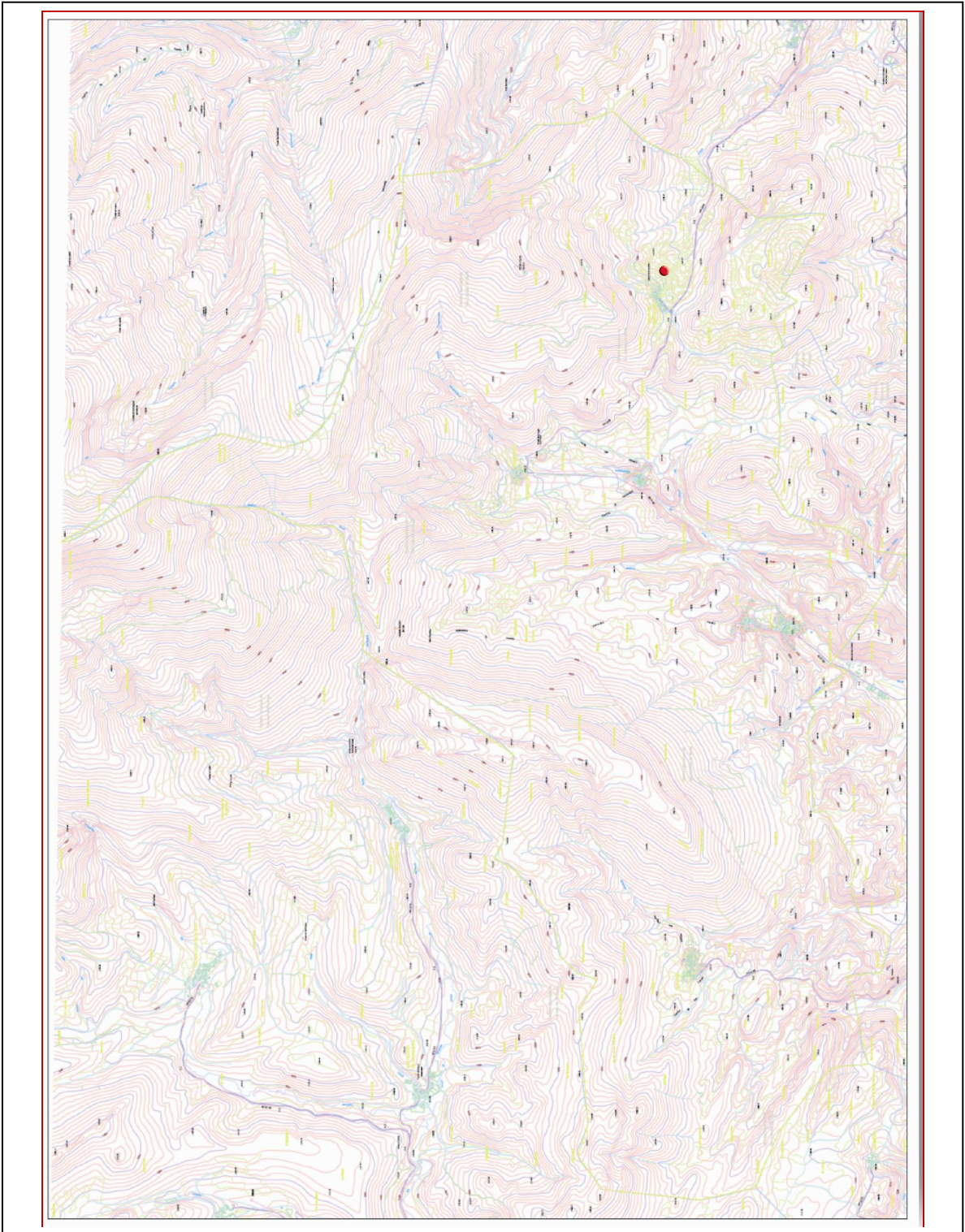
San Cebrían de Mudá. Escala 1/10000