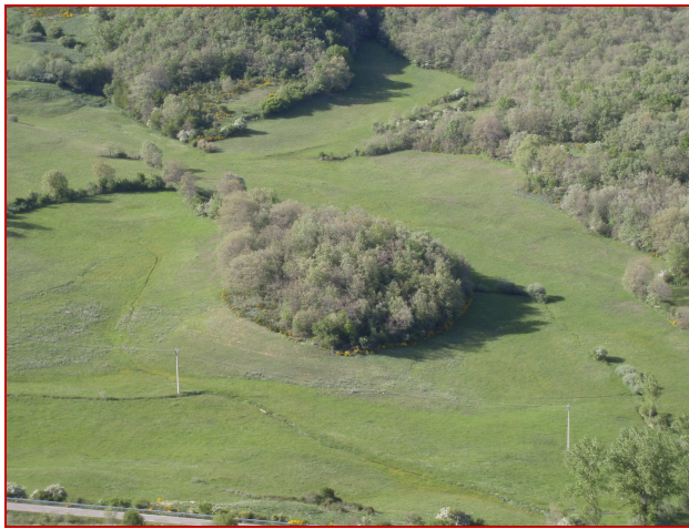
La Cotarra desde Sur