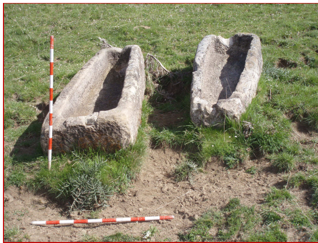
Sarcófagos descontextualizados procedentes de La Cotarra