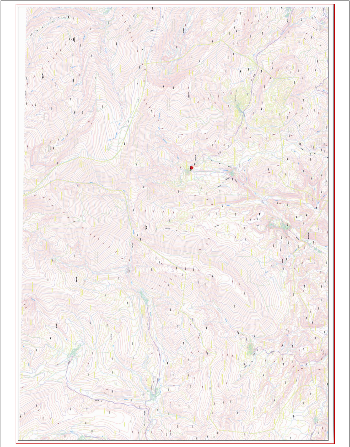
San Cebrián de Mudá. Escala 1/10000