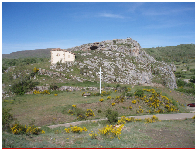
Ermita Virgen de la Peña desde Ermita de San Pedro