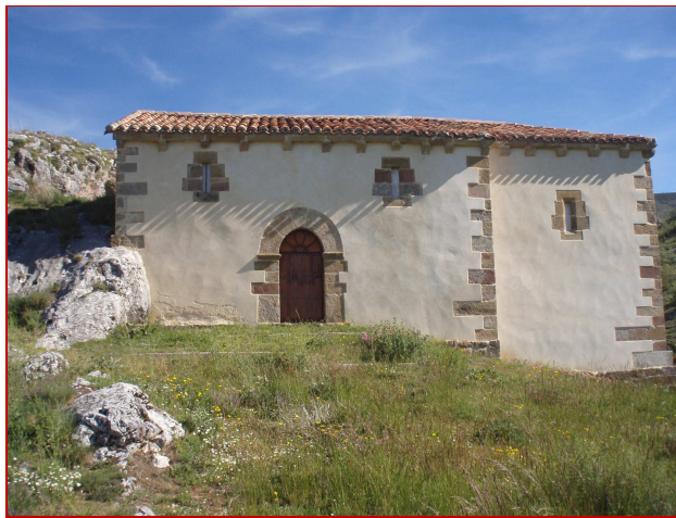
Ermita Virgen de la Peña desde el Sur